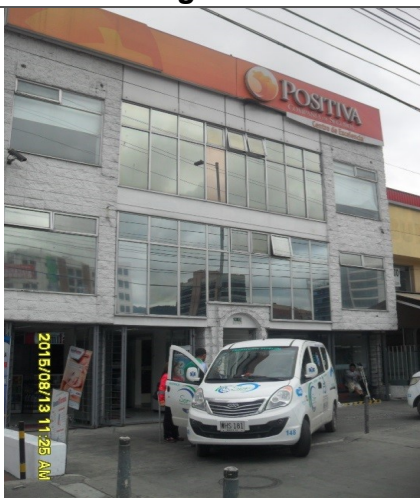
Fotografía No. 2: POSITIVA COMPAÑIA DE SEGUROS S.A Avenida Carrera 45 No 94-83. No cuenta con registro de publicidad Exterior Visual supera el antepecho del segundo piso