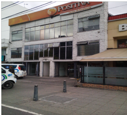
Fotografía No. 1: POSITIVA COMPAÑIA DE SEGUROS S.A Avenida Carrera 45 No 94-83. No cuenta con registro de publicidad Exterior Visual supera el antepecho del segundo piso

inconsistencias descritas dentro del término establecido en el acta de requerimiento, cuya fecha límite era 02/07/2015.